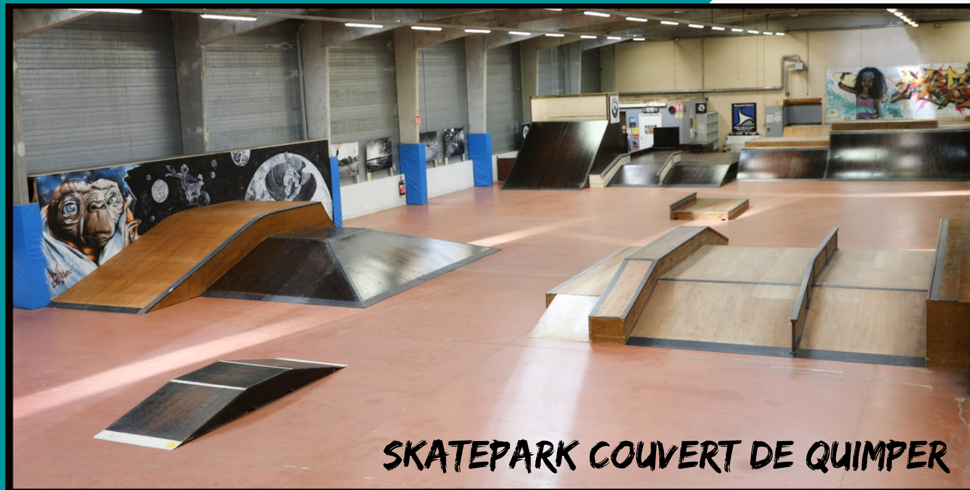
SKATEPARK COUVERT DE QUIMPER

54% de femmes / 46% d'hommes 64% ont moins de 25 ans